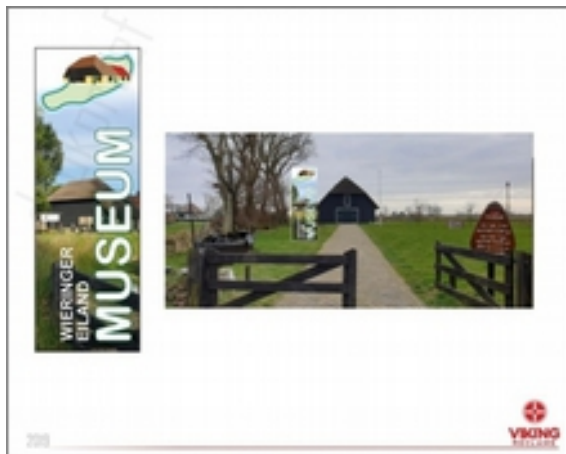
De nieuwe vlag van ons museum

De kunstitleen moet het hebben van zichtbaarheid en naamsbekendheid. Vandaar dat bij het trapgat een pijlbordje is opgehangen dat voor de kunstitleen naar boven wijst, en in de bezoekersruimte een kleine presentatie van de kunstitleen ingericht wordt, waarmee we de aandacht van de bezoekers trekken. Voorts wordt onderzocht of er een expositie in samenwerking met de Michaëlskerk mogelijk is.