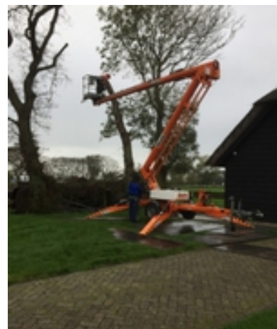
Oktober: kap van zieke iepen op ons erf